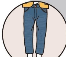
ジーンズ・ ジーンズ風ズボン